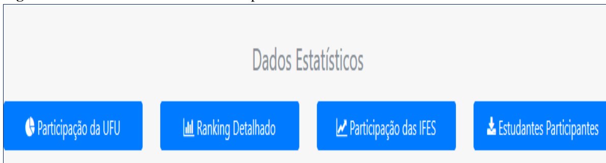
Figura 3. Dados Estatísticos relativos ao preenchimentos dos alunos no Portal das IFES.