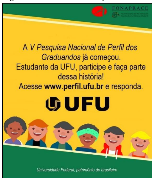
Figura 4. Panfleto utilizado pela Universidade Federal de Uberlândia (UFU).